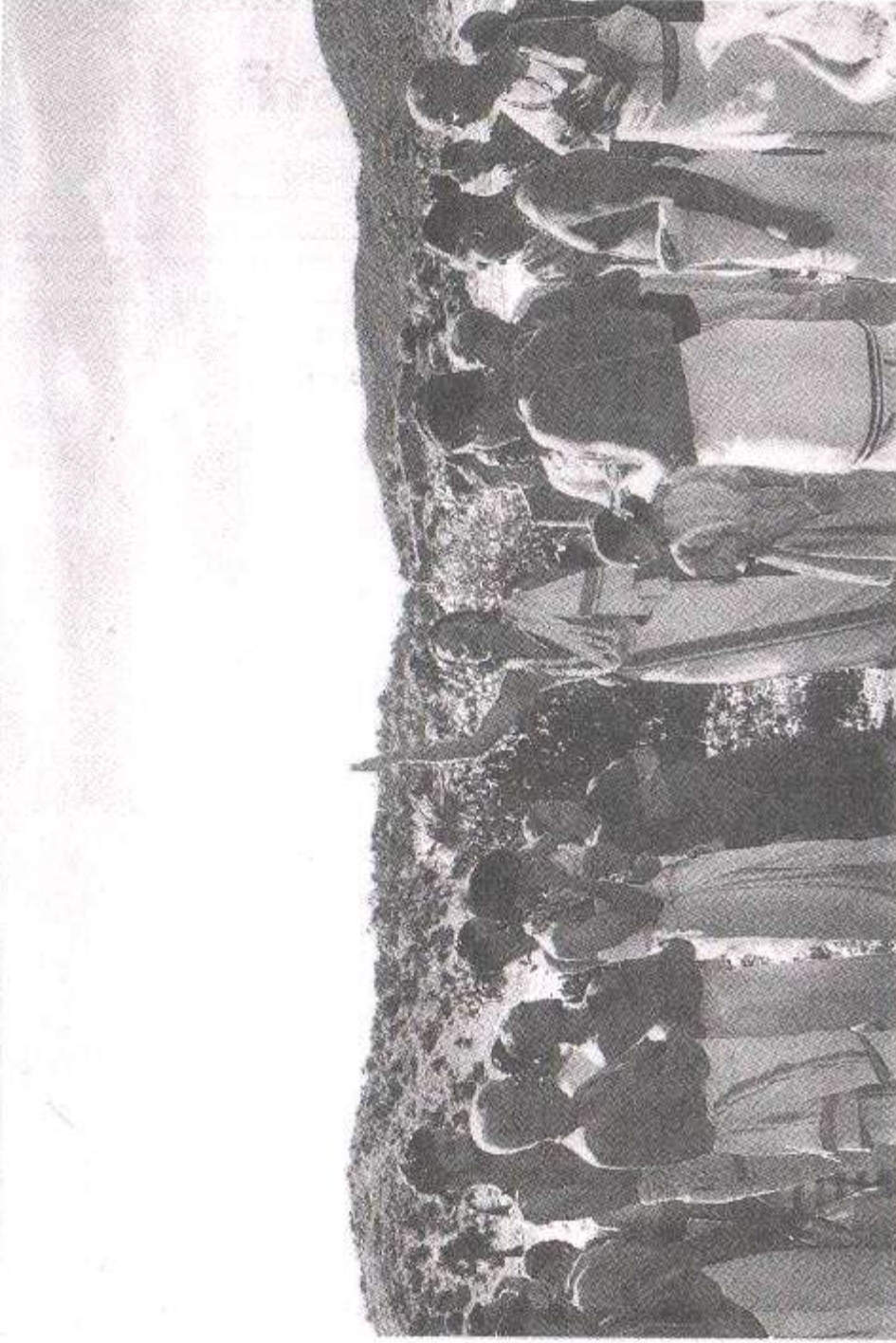
ப்ரஹ்மோத்ஸவத்தில் நம் ஸ்வாமிகளின் நகர ஸங்கீர்த்தனம்